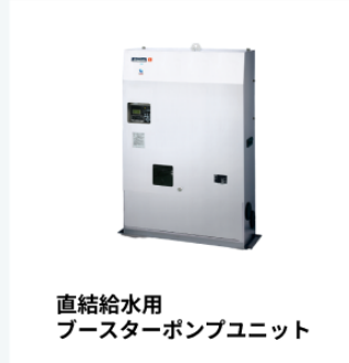
直結給水用 ブースターポンプユニット