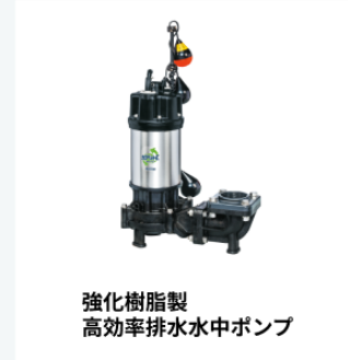
強化樹脂製 高効率排水水中ポンプ