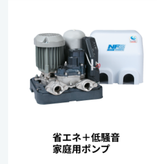
省エネ+低騒音 家庭用ポンプ