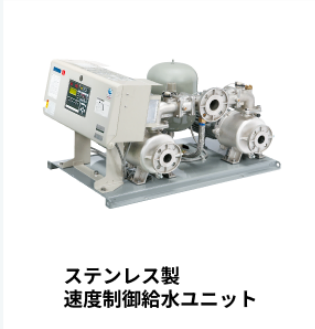
ステンレス製 速度制御給水ユニット