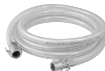
水中ポンプ用耐圧ホース