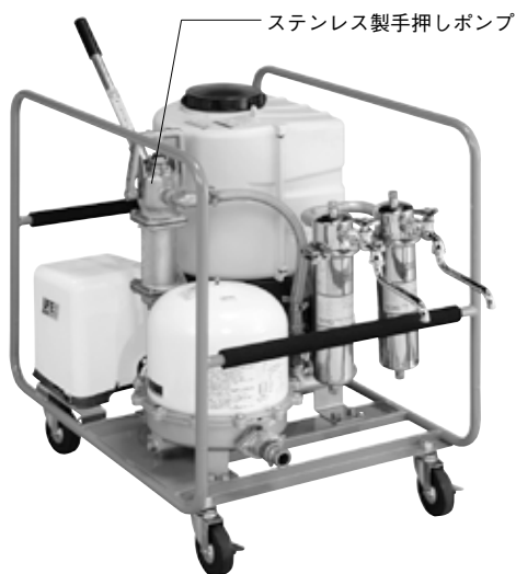
ステンレス製手押しポンプ