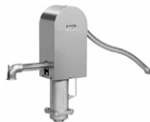
●ポンプカバー ※ポンプカバーのイメージになります