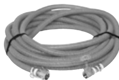
●スルース弁付 送水ホース20M ※スルース弁無し5M品もございます