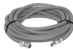
●送水ホース10M、20M (延長及び単独でも使用可)