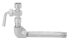
14K用 (赤水防止タイプ)